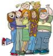
Konstruktion, test- och Operations team