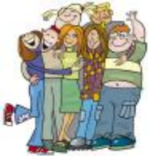
Konstruktion- och testteam